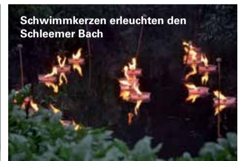
Schwimmkerzen erleuchten den Schleemer Bach