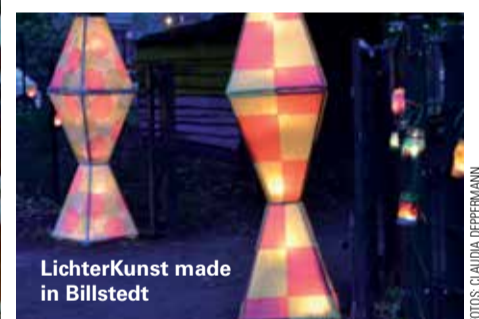
LichterKunst made in Billstedt