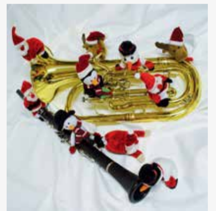
Mit den BilleBläsern in Weihnachtsstimmung kommen

Kontakt: Telefon 040 736 70 911, E-Mail info@billeblaeser-ev.de , www.billeblaeser-ev.de .