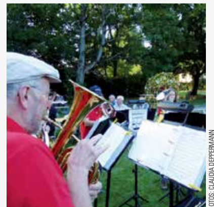
Die BilleBläser in Aktion – hier auf der LichterKunst im Schleemer Park