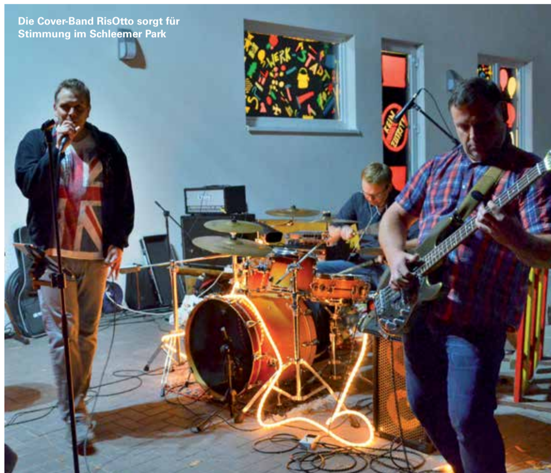
Die Cover-Band RisOtto sorgt für Stimmung im Schleemer Park

Bereits im 16. Jahr in Folge lud die Initiative Wir für Billstedt alle Nachbarn und Freunde ein, den Schleemer Park mit selbst gebastelten Lichtobjekten erstrahlen zu lassen. Trotz einiger Schauer füllte sich der kleine Park zur Dämmerstunde, so dass alle 25 Tische gut besetzt waren. Nach guter alter Tradition brachten viele Besuchergruppen ihr eigenes Picknick mit, um dem Motto „Mitmachen und genießen“ gerecht zu werden. Das musikalische Rahmenprogramm lieferten die BilleBläser sowie die Coverband RisOtto. Große Begeisterung lösten neben der traditionellen Feuershow auch die Darbietungen der Gruppe White Lotus aus. „Wir freuen uns, dass so viele Menschen unserer