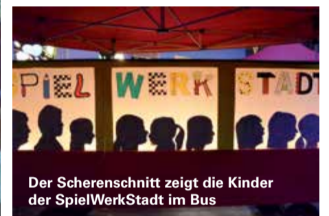
Der Scherenschnitt zeigt die Kinder der SpielWerkStadt im Bus